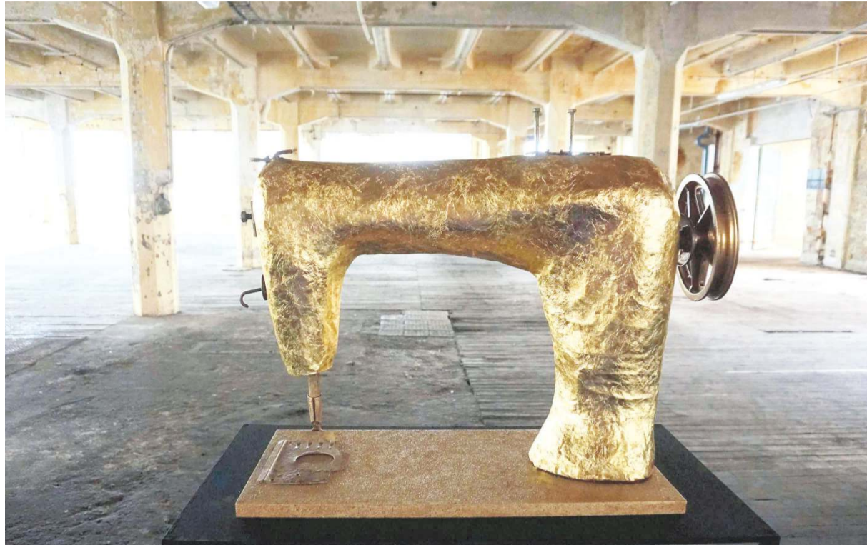
„Goldstaub“ heißt diese Arbeit von Dorothea Neumann.